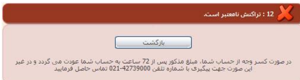
تصویر ۱۲-نمایش اخطار تراکنش ناموفق

با دریافت پیغام جهت مراجعه به پورتال، برای مشاهده وضعیت خود اقدام نمایید. از طریق پورتال سازمان امور دانشجویان سربرگ کارتابل را انتخاب نمایید.(تصویر 13)