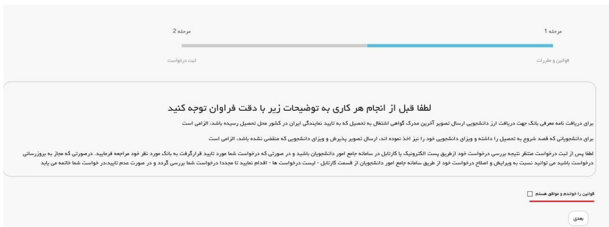
تصویر 2-موافقت با قوانین گفته شده

سیستم فرم را به شما نمایش داده و در صورتی که گزینه قوانین را خواندم و موافق هستم را انتخاب نمایید با کلیک بر روی دکمه بعدی، فرم درخواست صدور گواهی اشتغال به تحصیل دانشجویان خارج به شما نمایش داده می شود. (تصویر 2)