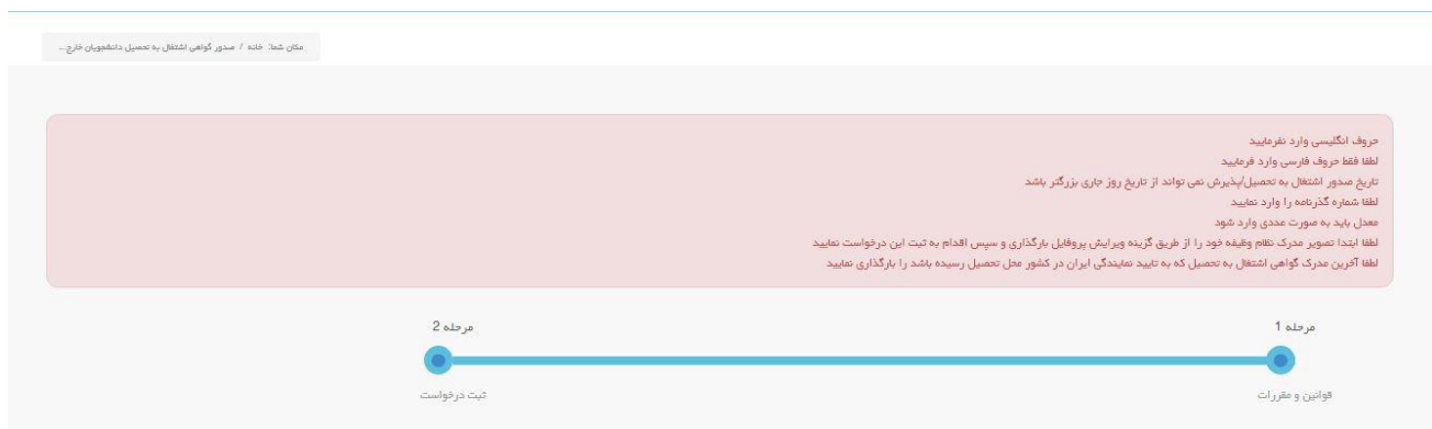
تصویر ۹- نمایش اخطار در صورت وارد نکردن فیلد های اجباری

در صورت خالی بودن فیلد های اجباری با پیغامی در بالای صفحه مواجه می شوید که سیستم از ثبت درخواست شما جلوگیری می کند. (تصویر ۹)