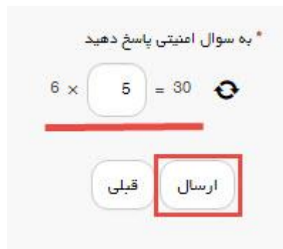
تصویر ۸- سوال امنیتی

سپس به سوال امنیتی پاسخ داده و بر روی دکمه ارسال کلیک کنید. (تصویر ۸)