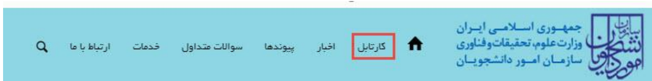
تصویر ۱۳-کارتابل شخصی

با دریافت پیغام جهت مراجعه به پورتال، برای مشاهده وضعیت خود اقدام نمایید. از طریق پورتال سازمان امور دانشجویان سربرگ کارتابل را انتخاب نمایید.(تصویر 13)