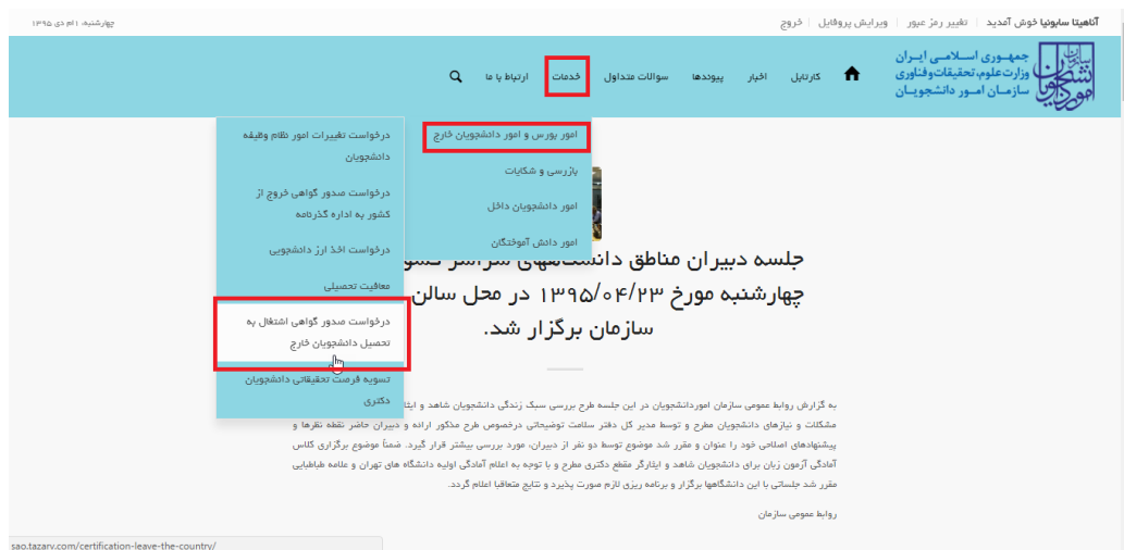
تصویر ۱-نمایش پورتال

از طریق پورتال سازمان امور دانشجویان و از سربرگ خدمات، بخش امور بورس و امور دانشجویان خارج را انتخاب کرده و سپس در این قسمت جهت ثبت بر روی درخواست صدور گواهی اشتغال به تحصیل دانشجویان خارج کلیک نمایید. (تصویر 1)