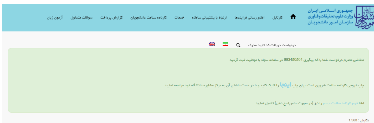
تصویر ۷- کد پیگیری و پیغام ثبت موفقیت آمیز

در صورت موفقیت آمیز بودن ثبت، سیستم کد پیگیری و پیغام ثبت موفقیت آمیز را در اختیار شما قرار می دهد. (تصویر 7)