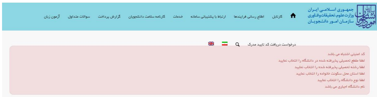
تصویر ۶- نمایش اخطار در صورت وارد نکردن فیلدهای اجباری

در صورت خالی بودن فیلدهای اجباری و یا وجود مغایرت با پیغامی در بالای صفحه در هر مرحله مواجه می شوید که در این حالت سیستم از ثبت درخواست جلوگیری می کند. (تصویر 6)